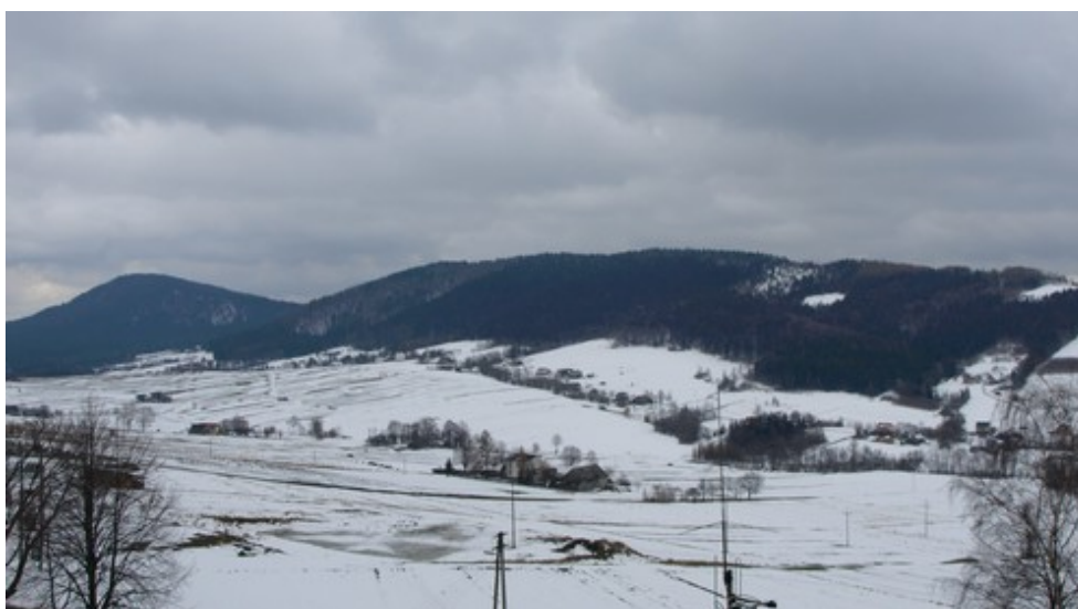
Rosochatka i Jodłowa Góra (widok z Mogilna)