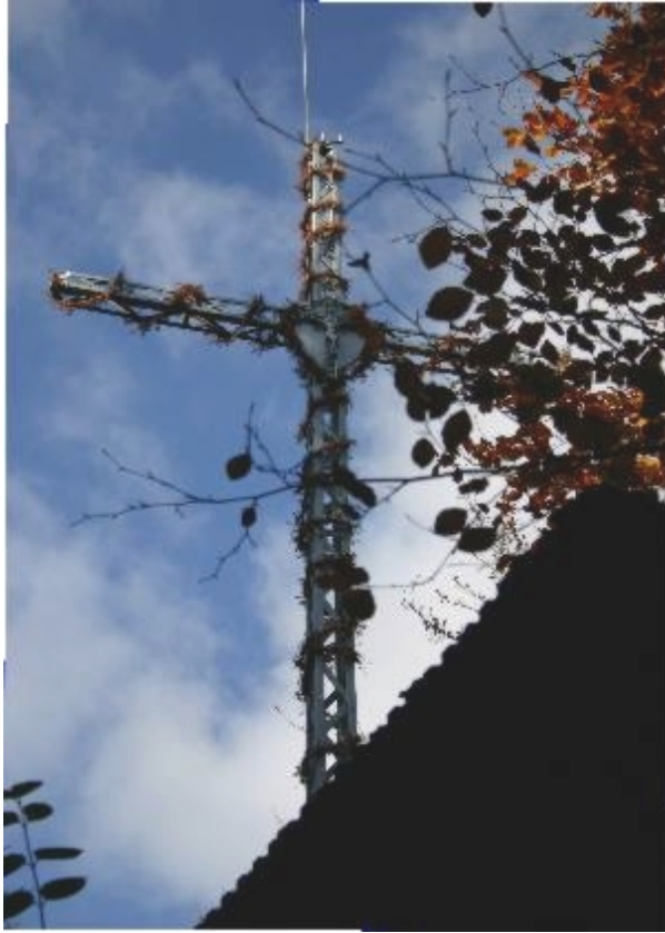
Krzyż na Rosochatce