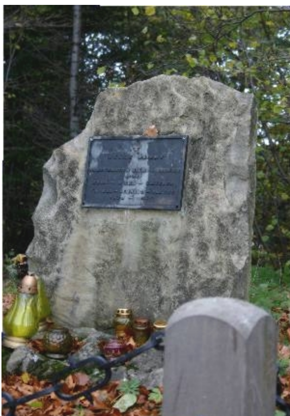
Pomnik powstańców na Jodłowej Górze