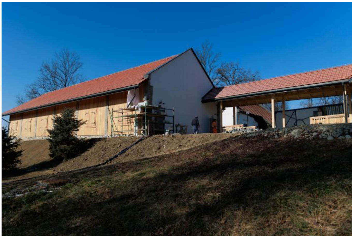
Aktualny stan prac