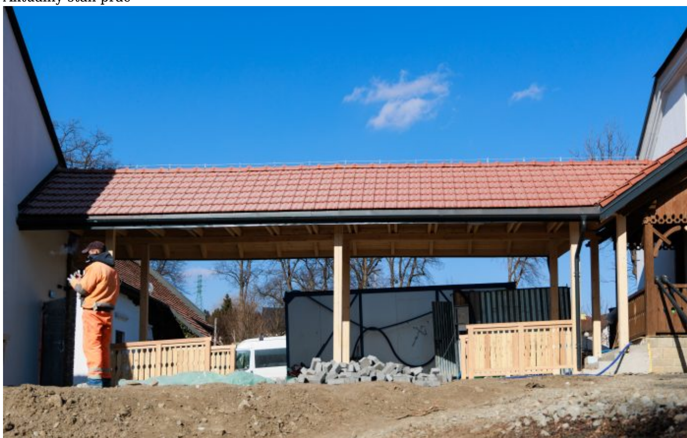
Aktualny stan prac