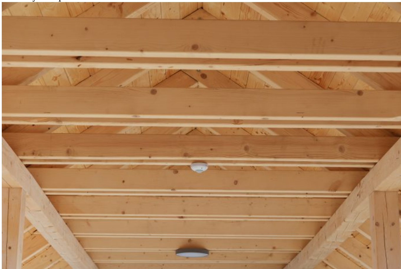
Aktualny stan prac