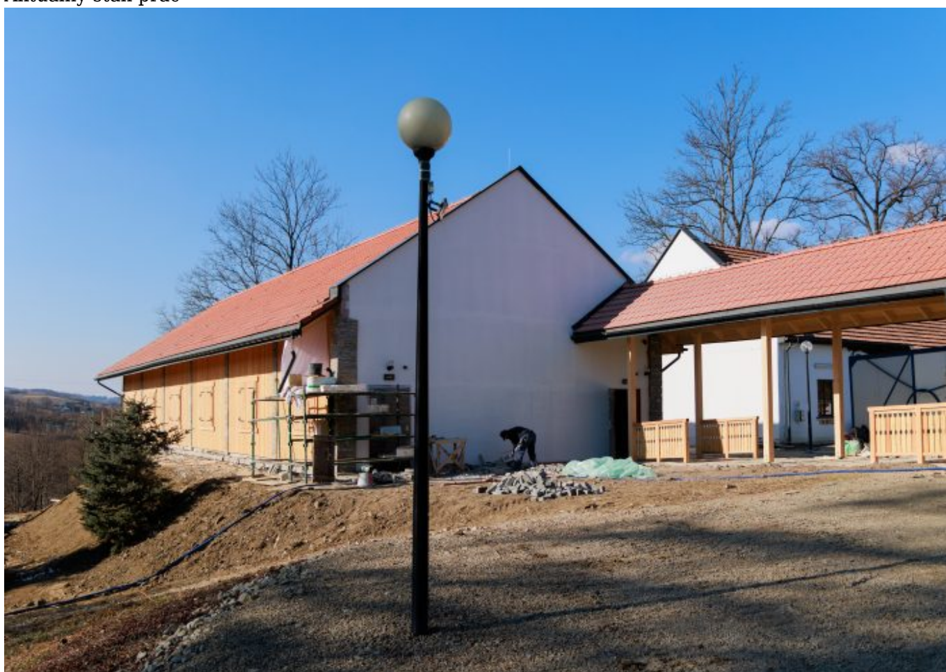
Aktualny stan prac

Tagi: Korzenna , inwestycja , rekonstrukcja , rozwój , stodoła