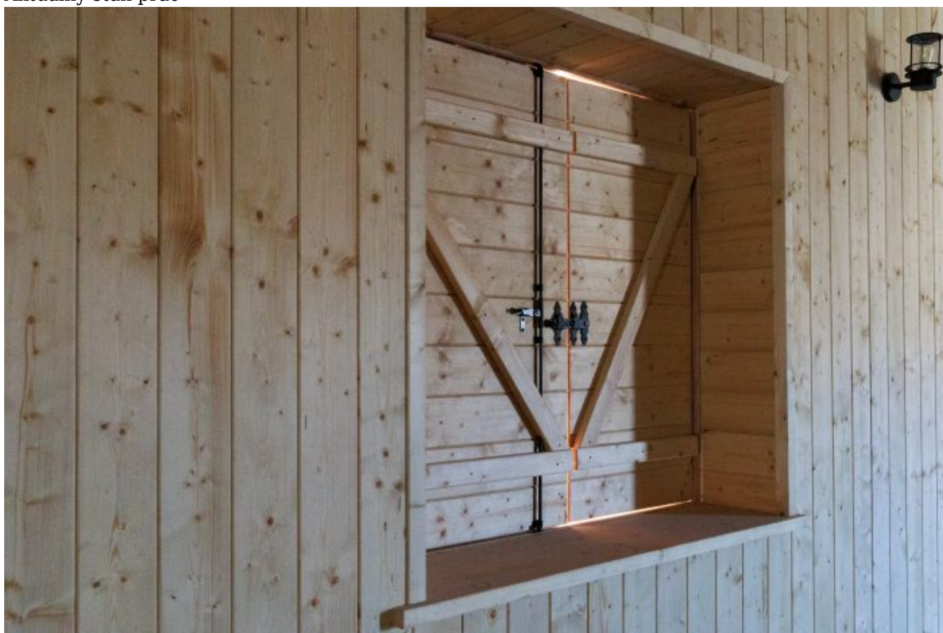
Aktualny stan prac