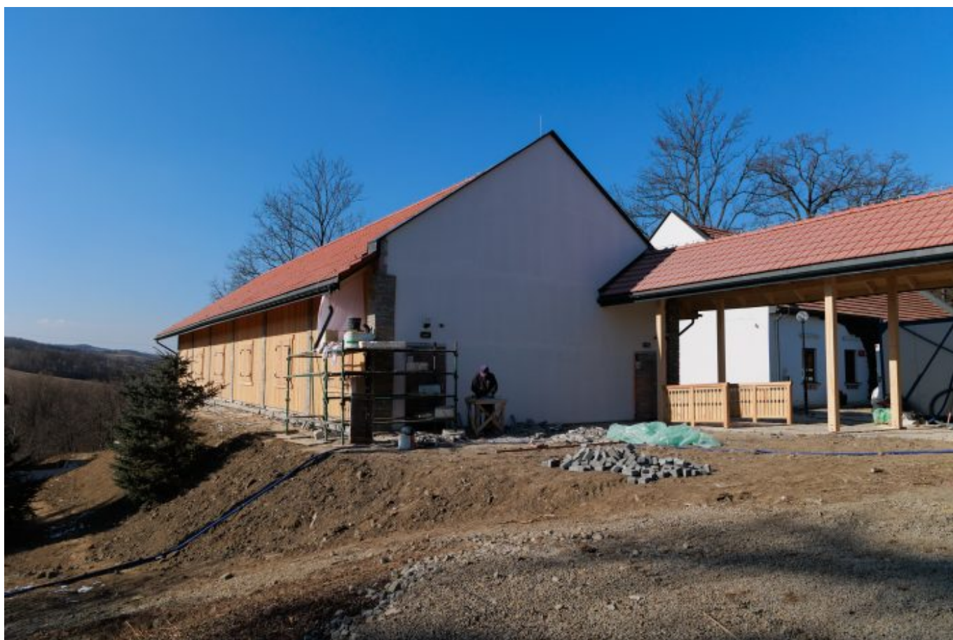
Rekonstrukcja stodoły w Korzennej – aktualny stan prac

O planach, których efektem miała być rekonstrukcja stodoły, pisaliśmy wcześniej . Informowaliśmy też o rozpoczęciu prac .